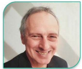
Bruno St-Pierre Communications